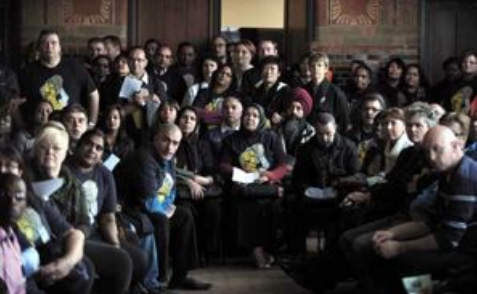
Het Schoonmakersparlement in De Burcht, Amsterdam oktober 2011.